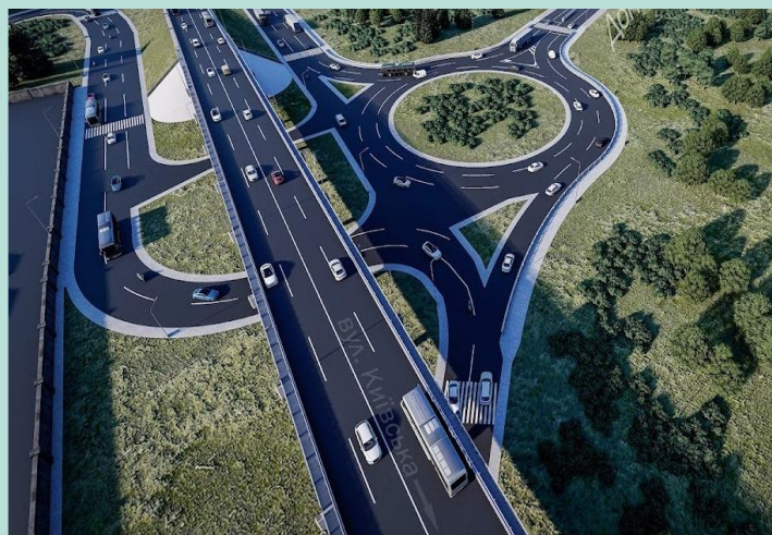
Планування та забудова міських транспортних вузлів і систем