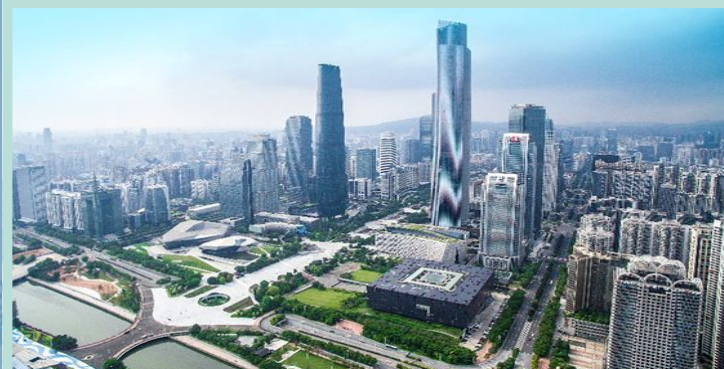
Проектування Smart City