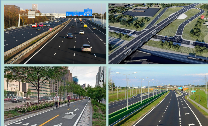
Міські вулиці і дороги