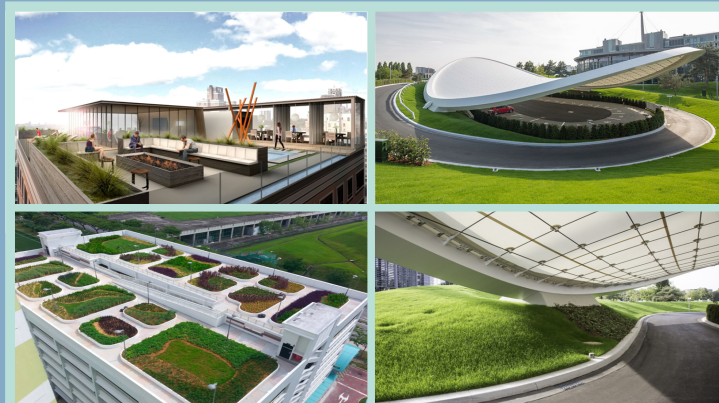
Інженерний благоустрій і озеленення міських територій