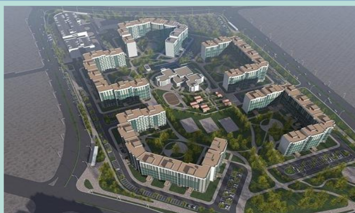
Планування і забудова територій